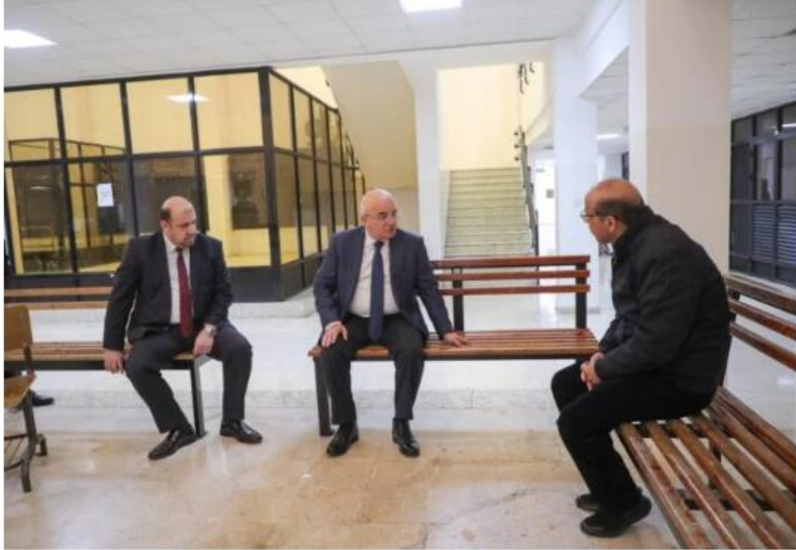
وكالة الجامعة الإخبارية

أكد الأستاذ الدكتور خالد الحياري رئيس الجامعة الهاشمية، ضرورة إنجاز عمليات الصيانة الدورية للقاعات الصفية والمختبرات والمساحات العامة في الجامعة خلال العطلة الفصليه التي تجري ضمن حطه طموحه وضمتهها الجامعة لتحديث مرافقها وتطوير بنيتها التحتية المادية والرقمية لتوفير البيئة الجامعية المثلى للطلبة التي تتكامل فيها مختلف العوامل التي تحقق النجاح الأكاديمي لهم، وتحفزهم على الإبداع والابتكار، مما يوفر تجربة جامعية تفاعلية ومحفزة تلبي احتياجات الطلبة وتطلعاتهم.